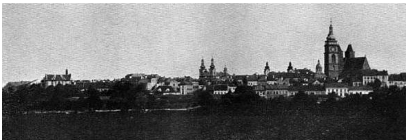
Hradec Králové z roku 1885